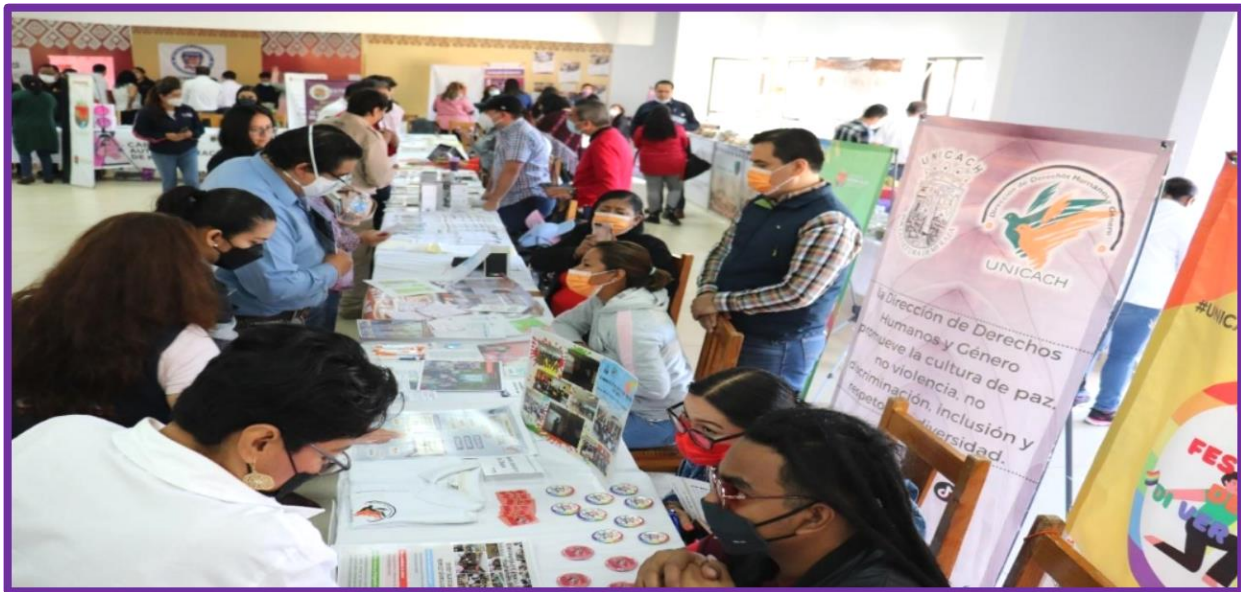
Lugar: Instalaciones de Fortalecimiento de Capacidades Económicas (La Albarrada), San Cristóbal de las Casas, Chiapas.