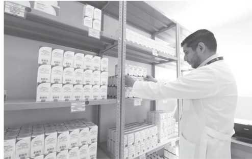
Con estas acciones, la entidad destaca a nivel nacional como el único estado del sureste con el mayor número de personas usuarias del método de prevención combinada contra el VIH.

En el marco del Día Internacional del Orgullo LGTTTQ+, que se conmemoró el pasado 28 de junio, la depen-